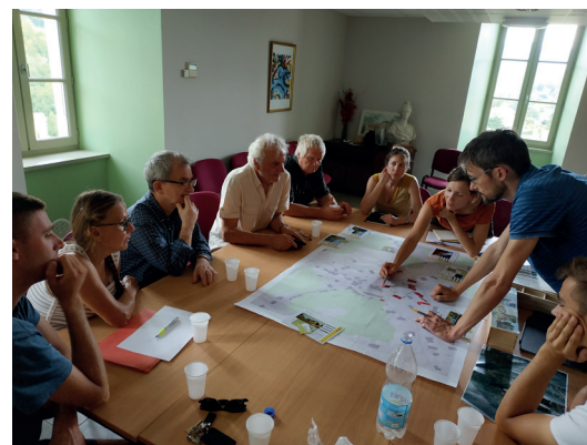
Atelier de travail à Prades avec des élus dans le cadre de la stratégie paysagère

Le travail sur la partie réglementaire (règlement écrit, zonage et les orientations d'aménagement et de programmation) est en cours de définition avec l'ensemble des acteurs (élus, partenaires institutionnels...). Il s'agit des pièces opposables aux futurs autorisations d'urbanisme permettant la déclinaison concrète des orientations du PADD.